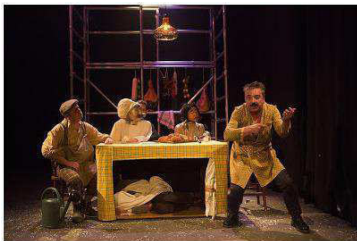
© Ludo Leleu Oliver Twist - Théâtre de l'Épée de Bois

le SEUL manifeste Phaco, qui Ose DÉNICHÉR la CULTURE là où elle EST