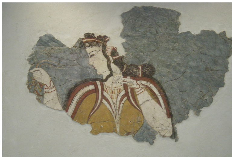
La dame de Mycènes (13 ème siècle av JC)