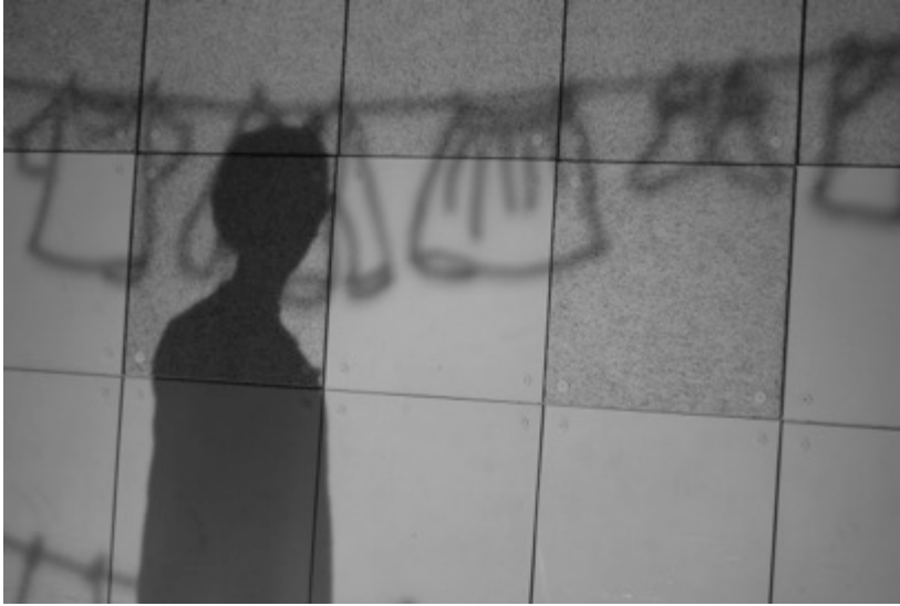
TABLEAU 4 : Je t'aime, je n'ai pas d'autre mot pour ça (extrait)

Une cuisine, en haut d'un rocher. Il fait presque noir.