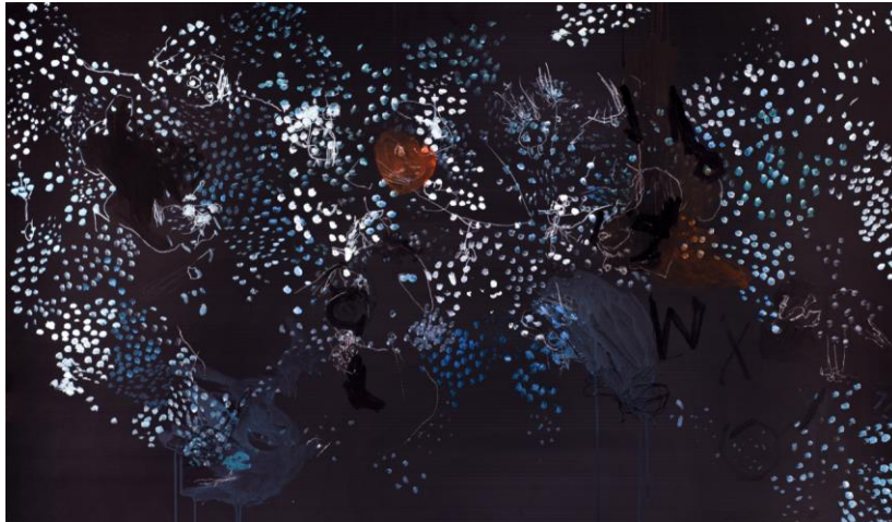
Illustrations : Isabelle Janier

06 60 43 21 13 // lastrada.cguizard@gmail.com