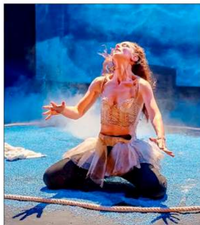
Quatre comédiens interpréteront des personnages habités par le désir.