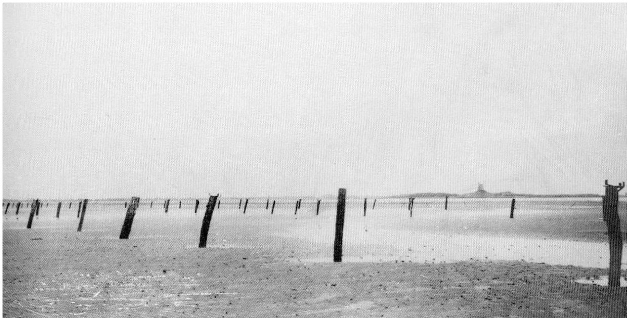
« Rommel avait fait planter des poteaux sur les plages, depuis Granville jusqu'à Cherbourg. Y'avait une mine sur chaque... on appelait ça : « Les asperges à Rommel ».

Depuis 1994, l' Air du Verseau , notre compagnie parisienne travaille autour du théâtre, du conte et quelquefois des arts pluridisciplinaires. Nous voulons mettre l'expertise de l' Air du Verseau au service de notre nouvelle-née Lihou Drama pour reprendre Les Asperges à Rommel en Normandie, car ce spectacle au thème universel, collecté dans la Manche, touche plus particulièrement la mémoire de cette région.